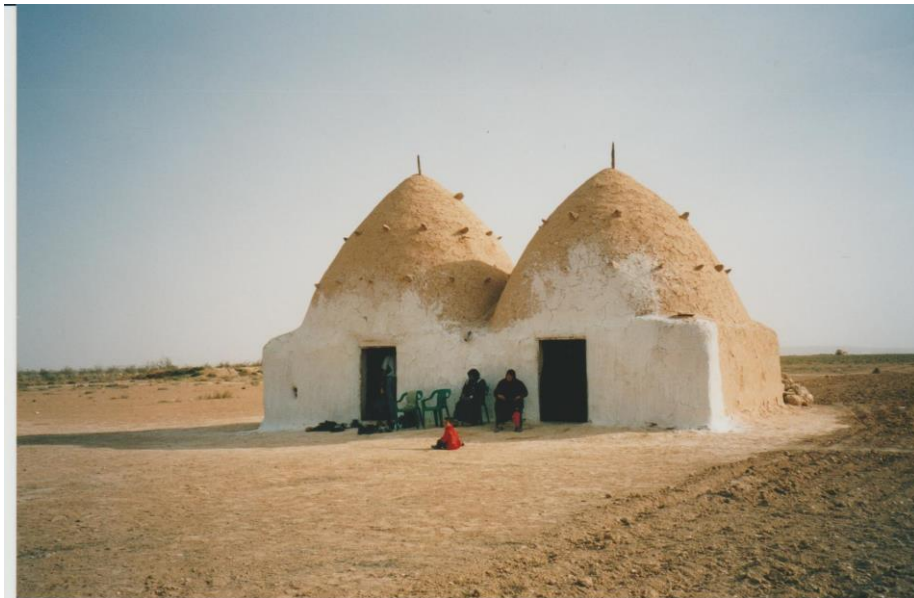
Een "UR" huis in de woestijn tussen Aleppo en Palmyra (Ur der Chaldeeën) Nehemia 9 vers 7 Syrie 24.10.2002